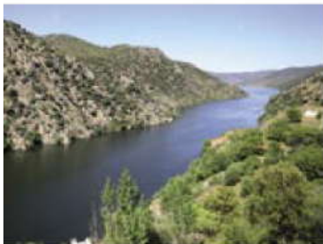
Vista de Las Arribes.

Desde la localidad se pueden emprender varias excursiones por el término.