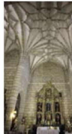
Iglesia Parroquial de Vilvestre.