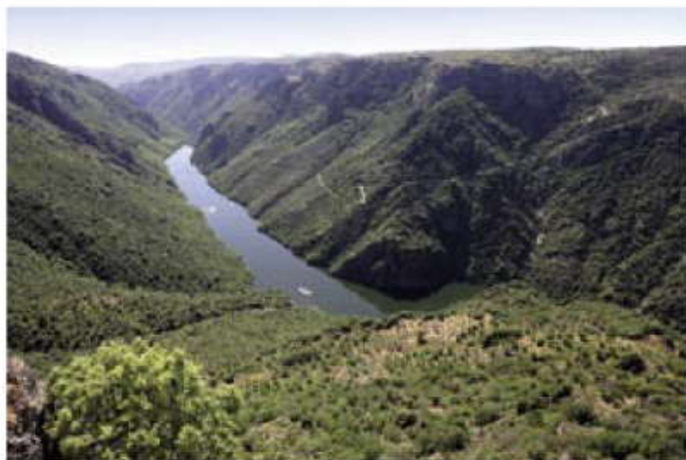
Vista desde La Code.