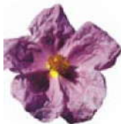
Jara de flor rosa ( Cistus albidus ).

El Museo Etnológico de Puerto Seguro nos ofrece un regreso a las vidas pasadas, en esta tierra donde se cruzan influencias de fronteras antiguas y actuales, rayas más o menos sutiles que también están en los oficios y en las tareas diarias.