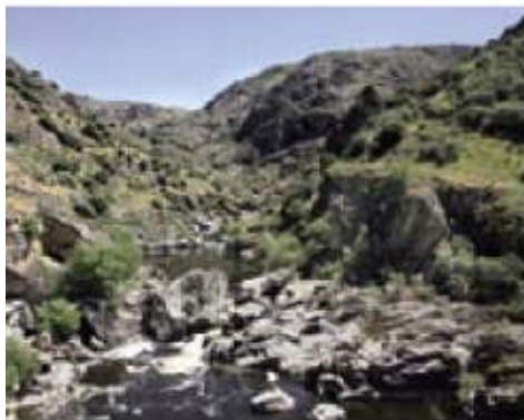
Cachón de Camaces.

nos podemos asomar desde un mirador. Otro recurso digno de visita es la Fuente El Obispo , un magnífico ejemplar: