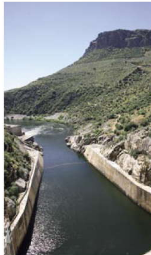
Salto de Saucelle y Penedo Durão.

El Salto de Aldeadávila se agazapa bajo enormes peñascos, en un fastuoso escenario natural que aparece en el largometraje Doctor Zhivago .