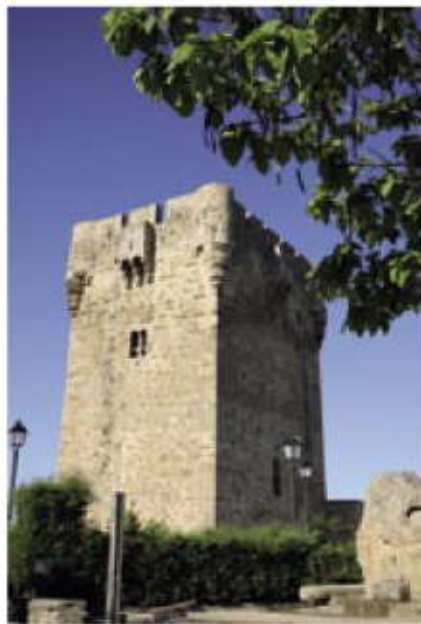
Torreón de Sobradillo.

Este es el punto de menor altitud de Castilla y León, con 123 m sobre el nivel del mar. Una playa fluvial nos permite disfrutar de un baño en la desembocadura del Águeda.