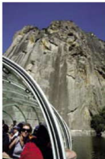
Paseos en barco.