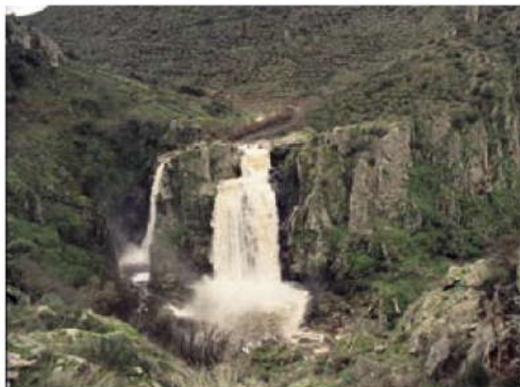
Pozo de las Humos.

Sus hechuras de centro comarcal y de gran nudo de caminos dejan sitio a la iglesia, con su poderosa torre, y a la plaza, en parte porticada, donde se toma el pulso de la comarca cada martes, día de mercado. Vitigudino ofrece buenas rutas por la gastronomía charra.