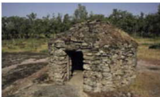
Chozos en Navasfrías.

Municipio fronterizo, con exuberante vegetación por las abundantes precipitaciones que reciben estas tierras. Toda la comarca de El Rebollar, y en especial Navasfrías, aprovecha sus valiosos recursos en setas, que aportan una renta complementaria a los lugareños. Dentro de la población podemos visitar el Museo Etnográfico, con una variada colección de utensilios de vidas antiguas y recientes.