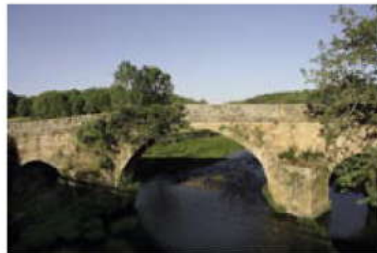
Puente de El Villar.

En la margen izquierda del río Águeda, en el término municipal de Fuenteguinaldo, se encuentra uno de los castros de la Edad del Hierro que posiblemente se convirtiera en una importante ciudad romana, el Castro de Iruña . Se halla en propiedad particular y es de difícil acceso, pero podemos llegar con una visita guiada que organiza el Ayuntamiento de Fuenteguinaldo.