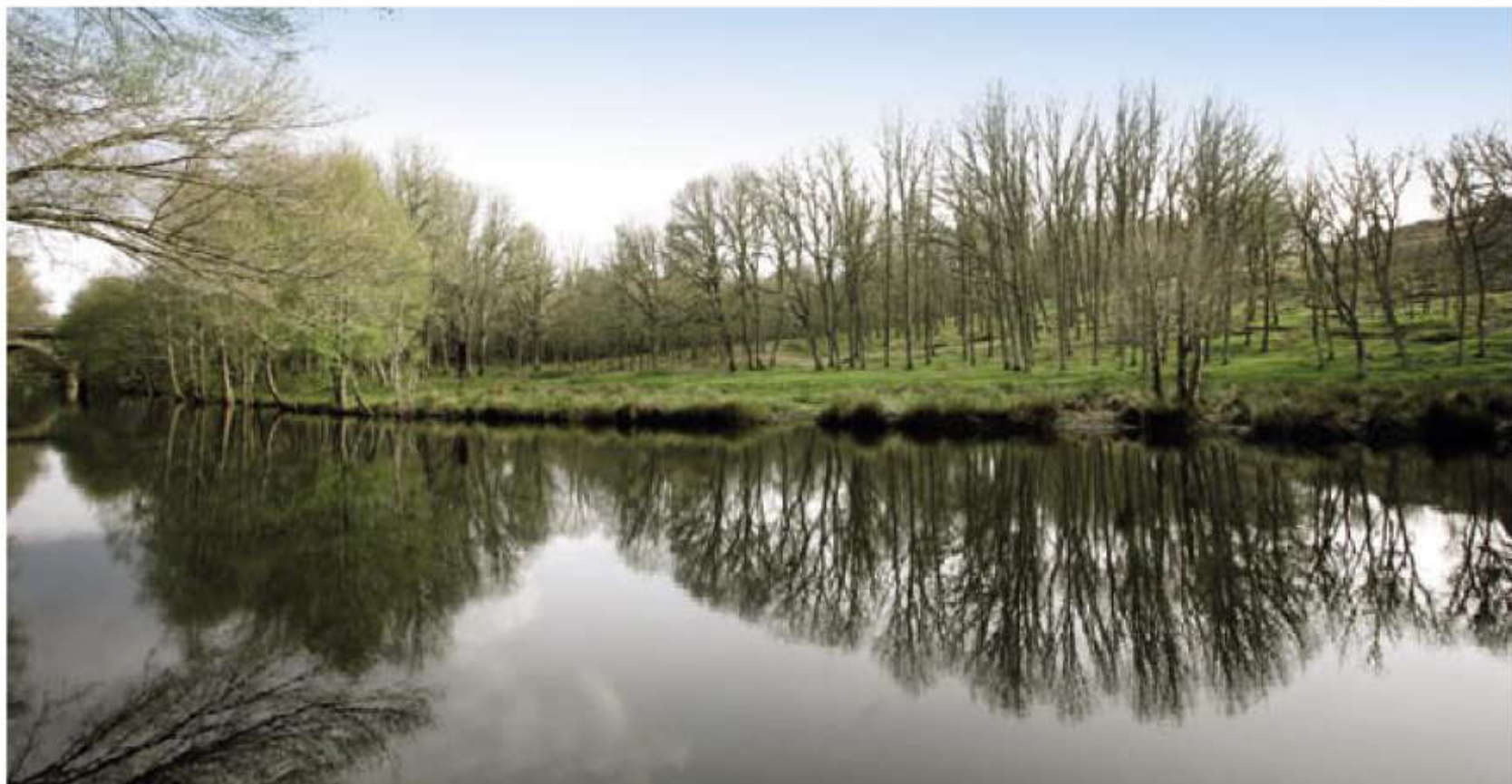
Río Frio entre Villasrubias y Peñarada.