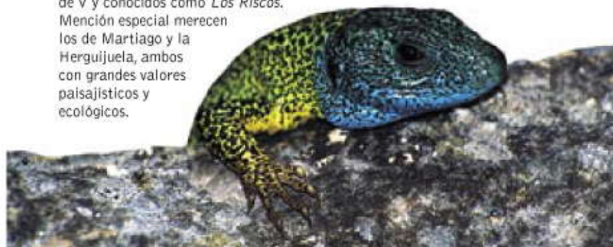
Lagarto Verdinegro ( Lacerta schreiberi ).

Es el río principal de la comarca. Nace en Navasfrías y comienza a encajonarse ya entre los términos de Fuenteguinaldo y Robleda. En el Campo de Agadones se encaja profundamente en el sustrato rocoso formando valles de gran belleza en forma de V y conocidos como Los Riscos . Mención especial merecen los de Martiago y la Herguijuela, ambos con grandes valores paisajísticos y ecológicos.