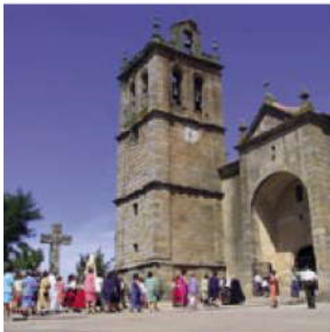
Iglesia parroquial de El Bodón.

El retablo de la iglesia de Fuenteguinaldo comenzó su construcción allá por el año 1563. Según Gómez Moreno es el único ejemplar de su género en la provincia, como obra escultórica de la segunda mitad del siglo XVI. Píriz lo califica como renacentista manierista. Su autor es Lucas Mitata, según se lo atribuye A. Herrero Durán en el libro Fuenteguinaldo en el espejo de su iglesia .