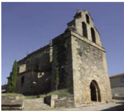
Iglesia parroquial de Robleda.

No podemos dejar de visitar la iglesia de Nuestra Señora de la Asunción, con su torre exenta, así como la ermita del Santo Cristo de la Vera Cruz o del Humilladero, situada a la salida hacia El Bodón, junto a las cruces del Calvario.